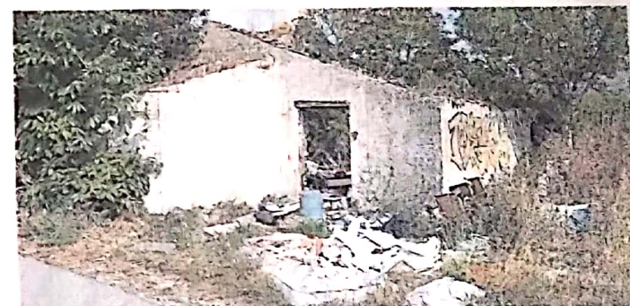
Une vision peu engageante, au bord du chemin.